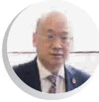
市人大代表 杨国平